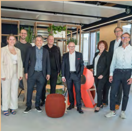
Bank & Finanzen