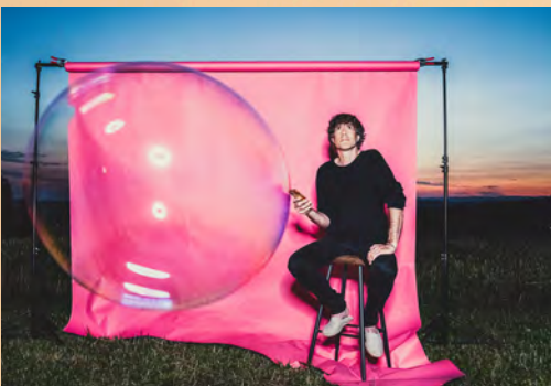
Musik & Konzerte