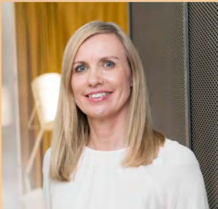
Wohnen & Zukunft